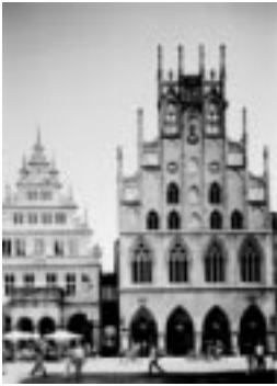
Rathaus mit Friedenssaal aus der Mitte des 14. Jahrhunderts

die Fachhochschule Münster zu einer „Studentenstadt“. Sie geben der Stadt ein junges Gesicht und füllen sie mit Leben. Abends findet man so manchen Studenten vielleicht in einer der vielen Kneipen 13 der Stadt. Schon früh war Münster für seinen hohen Verbrauch an Bier bekannt.