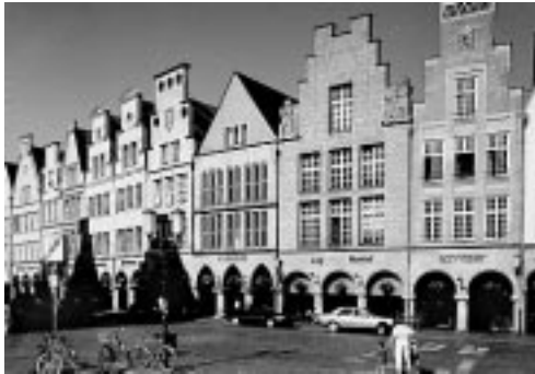
Der Prinzipalmarkt mit seinen schönen Giebelhäusern

Östlich des Domes liegt das Zentrum der Stadt mit dem Prinzipalmarkt. Die hohen Giebelhäuser 6 mit ihren Bogengängen 7 gehören wie das Rathaus in ihrer Mitte zu den Wahrzeichen der Stadt. Leider wurde die Altstadt im Krieg fast völlig zerstört. Später wurde sie aber sehr schön in ihren alten Straßenzügen wieder aufgebaut.