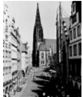
Die Kirche St. Lamberti

Vom Markt aus sehen wir noch eine andere interessante Kirche, die Kirche St. Lamberti. 298 Treppenstufen führen auf den Turm, von dem man einen herrlichen Rundblick auf Münster und die Umgebung hat. Abends, von 21 bis 24 Uhr steht hier ein „Türmer“ 10 , einer der wenigen, die es in Deutschland und Europa noch gibt. Seine Aufgabe ist es, über die Stadt zu wachen und